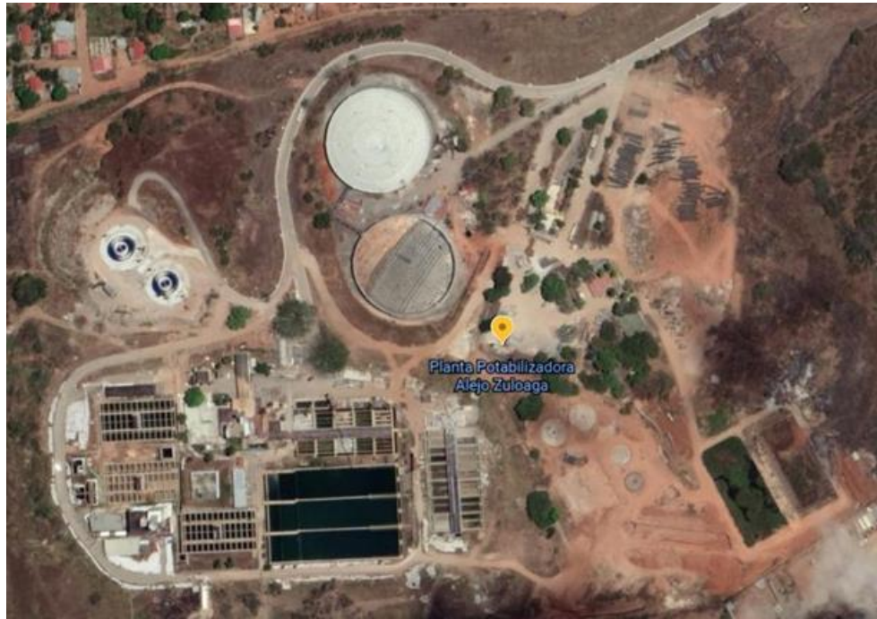
Imagen satelital tomada en 2018

Sistema: Sistema Regional del Centro Operadora: HIDROCENTRO Población atendida: Valencia y alrededores (Naguanagua, San Diego, Los Guayos y Libertador)