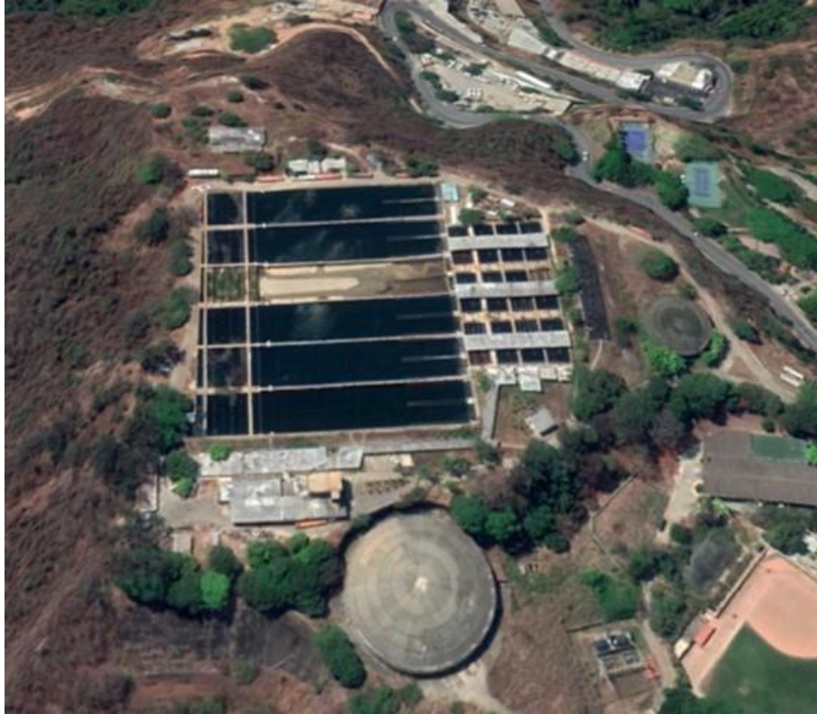
Imagen satelital tomada en 2019

Sistema: Acueducto de Caracas, Tuy II Operadora: HIDROCAPITAL Población atendida: Municipios Sucre, Chacao, El Hatillo, sectores del municipio Baruta y sectores del Municipio Libertador.