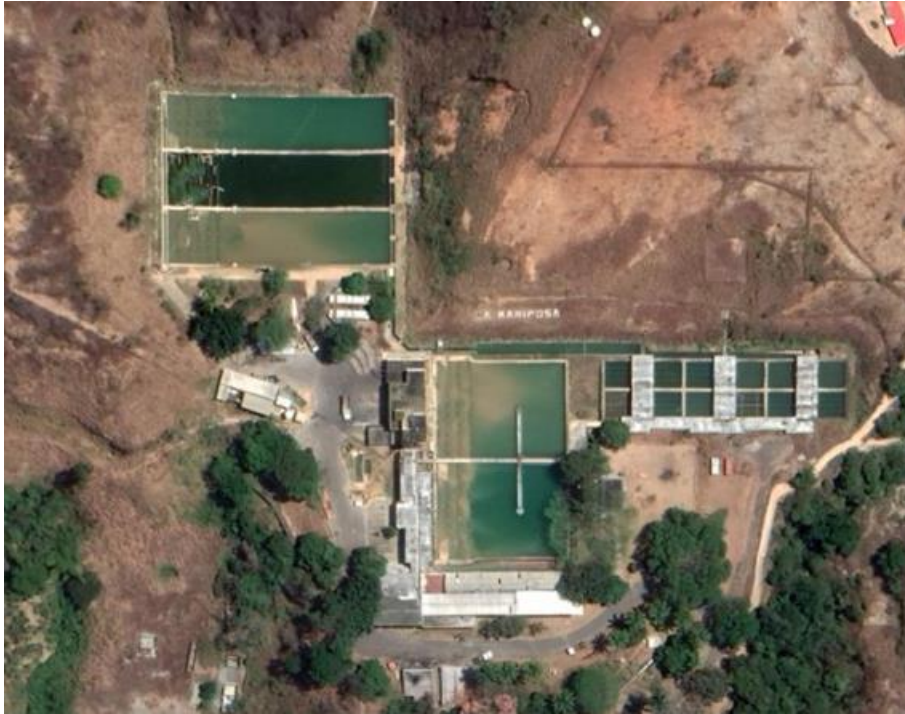
Imagen satelital tomada en 2019

Sistema: Tuy I del Acueducto Metropolitano de Caracas y Panamericano Altos Mirandinos Operadora: HIDROCAPITAL Población atendida: Altos Mirandinos y parte de la ciudad de Caracas